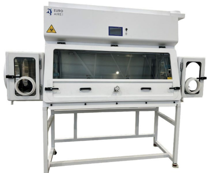
Modell CBK + 2 SAS