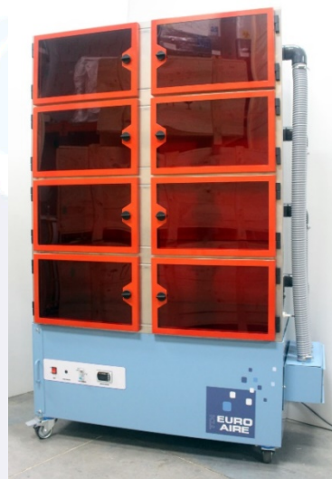
Modèle UA - Type 1