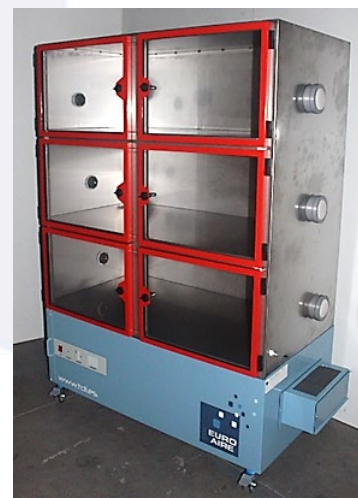
Modell UA – Typ 3 UAIN-3 + KOHLE