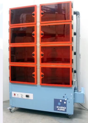
Modell UA – Typ I UAIN-I + LICHTZYKLEN + HEIZUNG